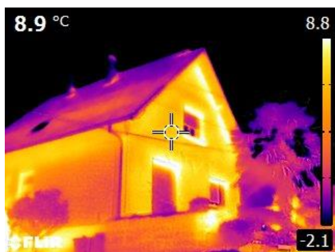
Exemple de cliché montrant les déperditions de chaleur d'une

Les clichés seront envoyés par courrier aux propriétaires qui pourront, s'ils le souhaitent, prendre rendez-vous avec un conseiller pour avoir une analyse énergétique détaillée de leur logement.